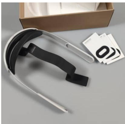
Hoofdband voor het bevestigen van een bril aan het hoofd