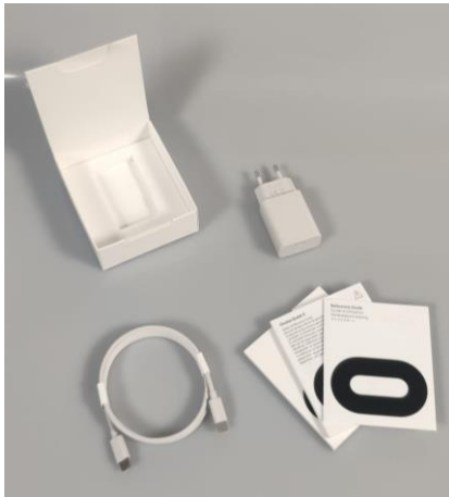
Doos met oplader en instructieboekje