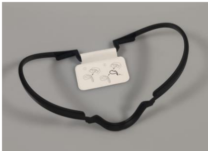
Adapter voor bril dragers