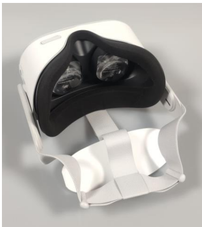
Virtual Reality Bril

Binnenin vinden we de volgende apparatuur: