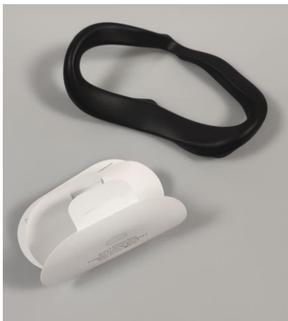
Voering voor een comfortabelere bril