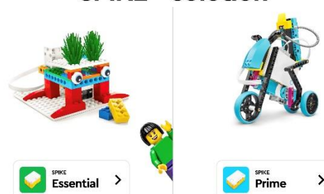
Figura 1: Primeiro Tela de aplicativo Lego Spike